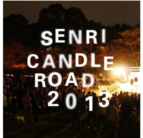
※写真は千里キャンドルロード 2012の様子です。