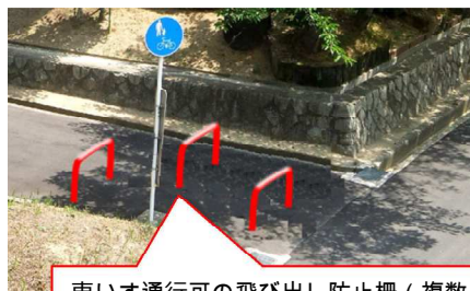
車いす通行可の飛び出し防止柵（複数）

上図はあくまで例であり、実際の柵の本数や間隔等は専門家と協議した上で決定します。